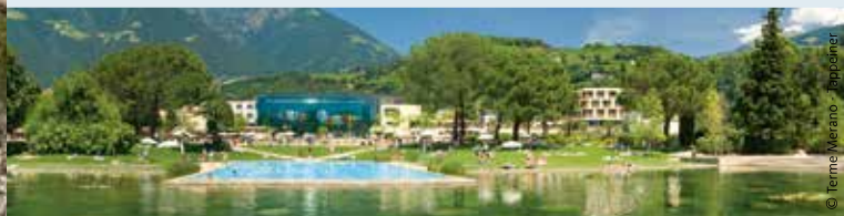
Terme Merano - Pappone

Il parco delle terme si estende per oltre 5 ettari ed offre diverse piscine, aperte d'estate ogni giorno. Vi si trova anche una zona kneipp e una piscina sportiva. Le Terme Merano hanno 15 piscine (interne ed esterne), 2.200 m² di area saune e bagni turchi . I rinnovati spazi relax e una stanza della neve sono perfetti per rilassarsi e fare una pausa.