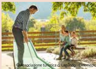
© Associazione turistica di Lagundo - Cirmepic