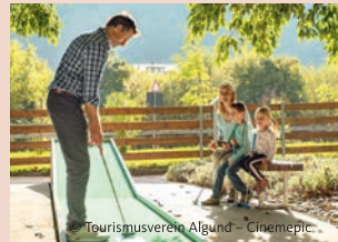
Tourismusverein Algend - Cinemepic